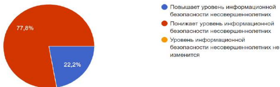
Диаграмма № 1. — Ответ на вопрос о влиянии процессов построения цифровой экономики на информационную безопасность несовершеннолетних

Результат предварительного опроса респондентов приведен на Диаграмме № 1.