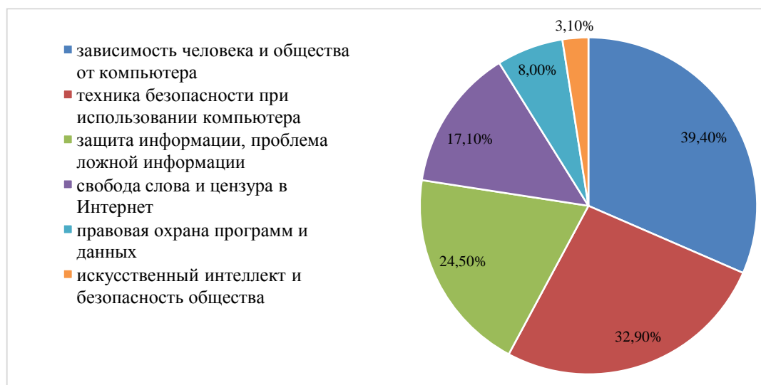
Рисунок 4 — Тематика мероприятий для детей в рамках обеспечения информационной безопасности.

На рисунке 4 представлены данные, полученные в ходе исследования, отражающие тематическую направленность мероприятий, которые педагоги проводят с детьми в рамках обеспечения информационной безопасности несовершеннолетних и защиты их информационных прав и свобод.