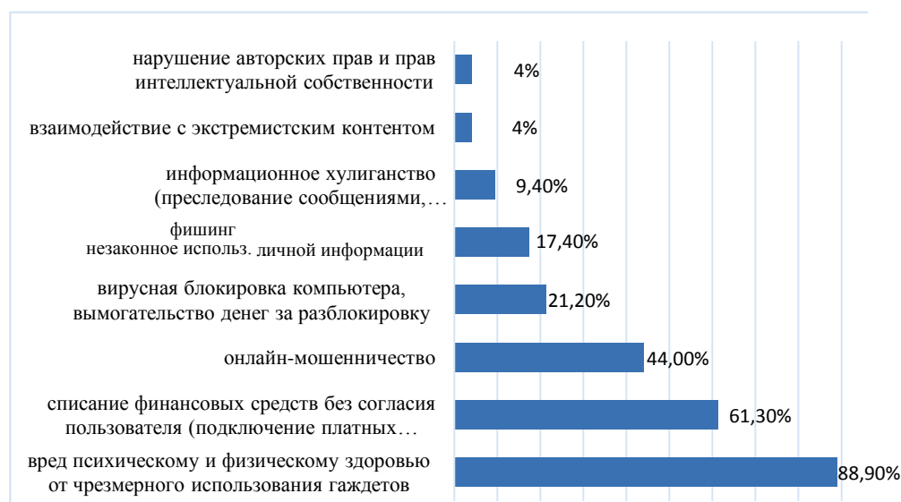
Рисунок 2 — Угрозы и опасности для детей в информационном пространстве

В ходе исследования респондентам был задан вопрос об опасностях и угрозах, с которыми могут столкнуться дети в ходе использования информационных технологий и глобального информационного пространства. На рисунке 2 представлены опасности и угрозы для детей по мнению педагогов.